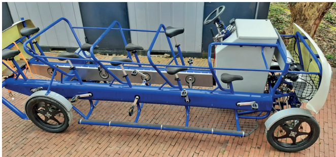
Cyclobus de Vétroz. Cyclobus von Vétroz.

L'ATE Valais est membre du comité de la faïtière « velo vs », fondée en 2019 et soutenue financièrement par le canton. Outre la promotion des « vélobus », organisés sur le même principe que les « Pédibus », l'ATE Valais a participé à une première : l'homologation temporaire d'un Cyclobus à Vétroz. Rappelons qu'un cyclobus est un véhicule à pédales qui permet à une dizaine d'enfants, accompagnés d'un adulte, de se déplacer sur le chemin de l'école. Le modèle mis en service à Vétroz est doté d'une assistance électrique, ce qui rend son usage plus facile et ludique. Ce projet est le fruit de l'engagement sans faille de la commune de Vétroz, qui l'a cofinancé avec le Service cantonal de la mobilité, ainsi que d'un partenariat avec le Service de la circulation routière et de la navigation et l'association Pro Vélo Valais/Wallis. Le Cyclobus de Vétroz circule depuis le 29 mai 2025.