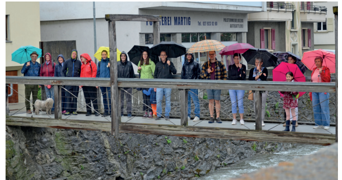
Jane's Walk in Brig. Jane's Walk à Brigue.

Am Samstag, 3. Mai 2025 nahmen in Brig rund 20 Personen am ersten Jane's Walk im Oberwallis teil. Dazu eingeladen haben die Walliser Sektionen von Fussverkehr Schweiz und VCS. Trotz Regen war der Jane's Walk ein voller Erfolg.