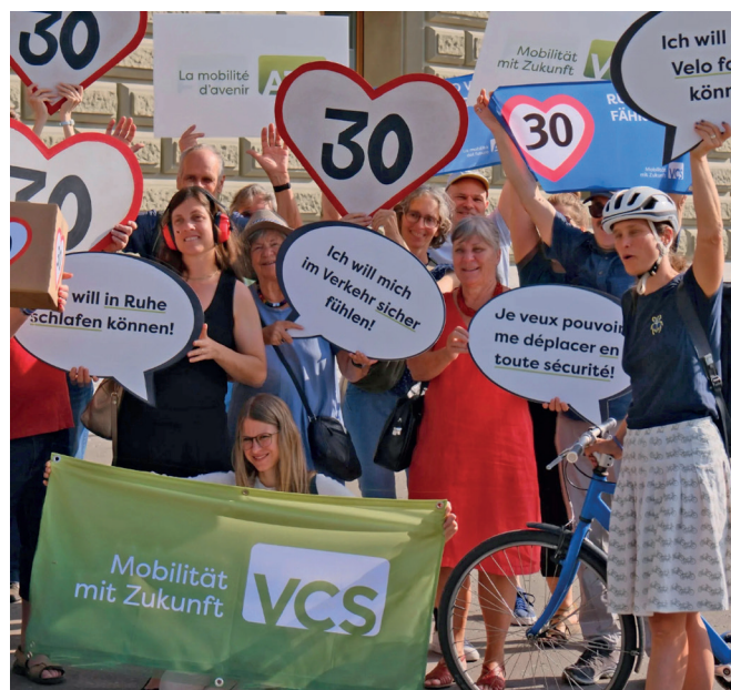
Übergabe der Petition für Tempo 30. Remise de la pétition pour la limitation de vitesse à 30 km/h.

In den letzten Monaten nahmen die Beratungen des VCS Wallis für die Einführung von Begegnungszonen (Tempo 20-Zonen) zu. In beiden Kantonsteilen meldeten sich VCS-Mitglieder aus Bergdörfern, die in der Gemeinde eine Begegnungszone anstossen möchten. Gute Voraussetzungen für eine Begegnungszone im Wohnquartier sind u.a.: 1) Wunsch der Anwohnerschaft nach mehr Aufenthaltsqualität und Sicherheit im Quartier; 2) fehlender Platz für Spiel und Sport im nahen Wohnumfeld, besonders für Kinder; 3) kein oder kaum Durchgangsverkehr; 4) verkehrsarme Strasse in Wohnquartier (maximal 100 Fahrzeuge pro Stunde); 5) kein öffentlicher Linienverkehr.